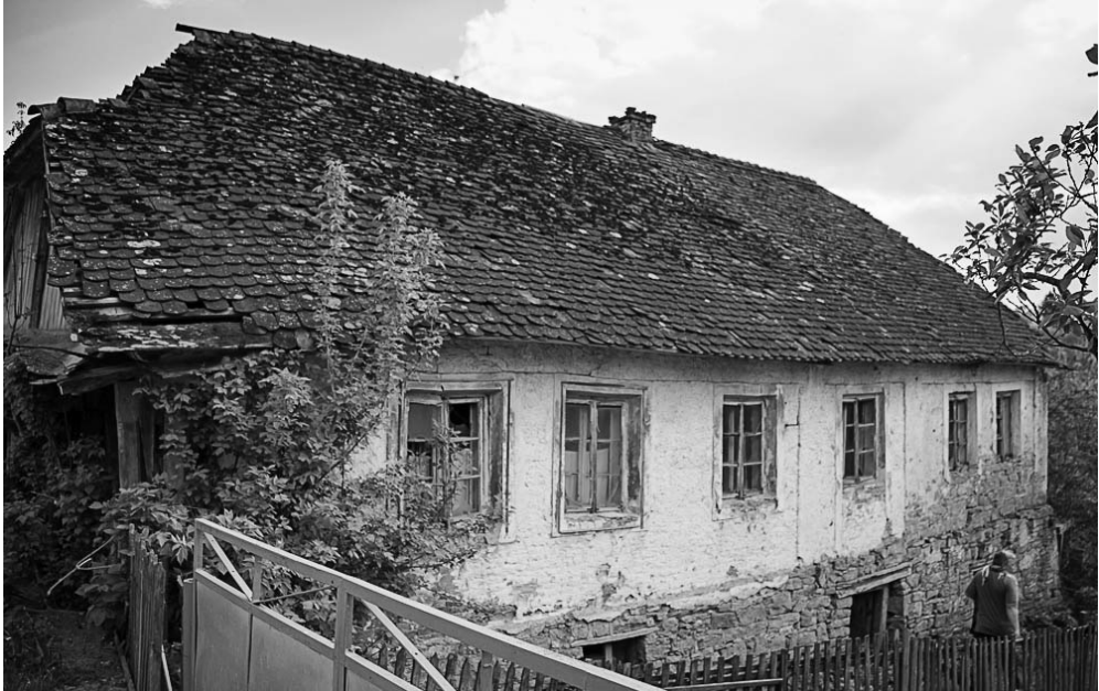
Еврейская хата в Сатанове