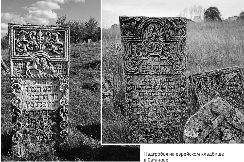
Надгробья на еврейском кладбище в Сатанове

заняла жандармерия. Большую синагогу нацисты использовали в качестве тюрьмы. 5 августа 1941 года начали первые расстрелы евреев. 14-15 мая 1942 года 240 евреев были заживо замурованы в подвале старинного дома. За время немецкой оккупации в Сатанове погибли 647 евреев, многие были вывезены и уничтожены за пределами местечка.