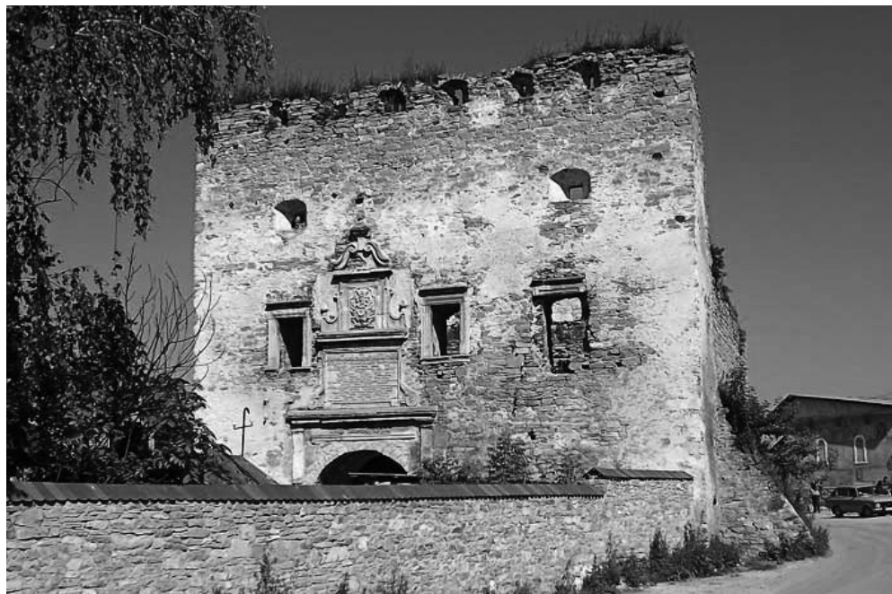
Развалины городских ворот Сатанова

Одровонжу, потомкам и наследникам которого эти земли принадлежали с того времени на протяжении более трехсот лет.