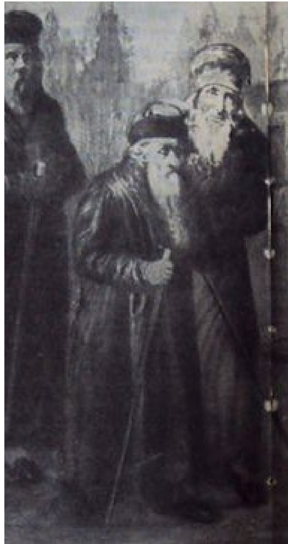
Бейт - дин Рава Акивы Эйгера (в центре)

Трое судей, если им позволяет компетенция, принимают решение по большинству, предварительно приведя доказательства в защиту своих мнений.