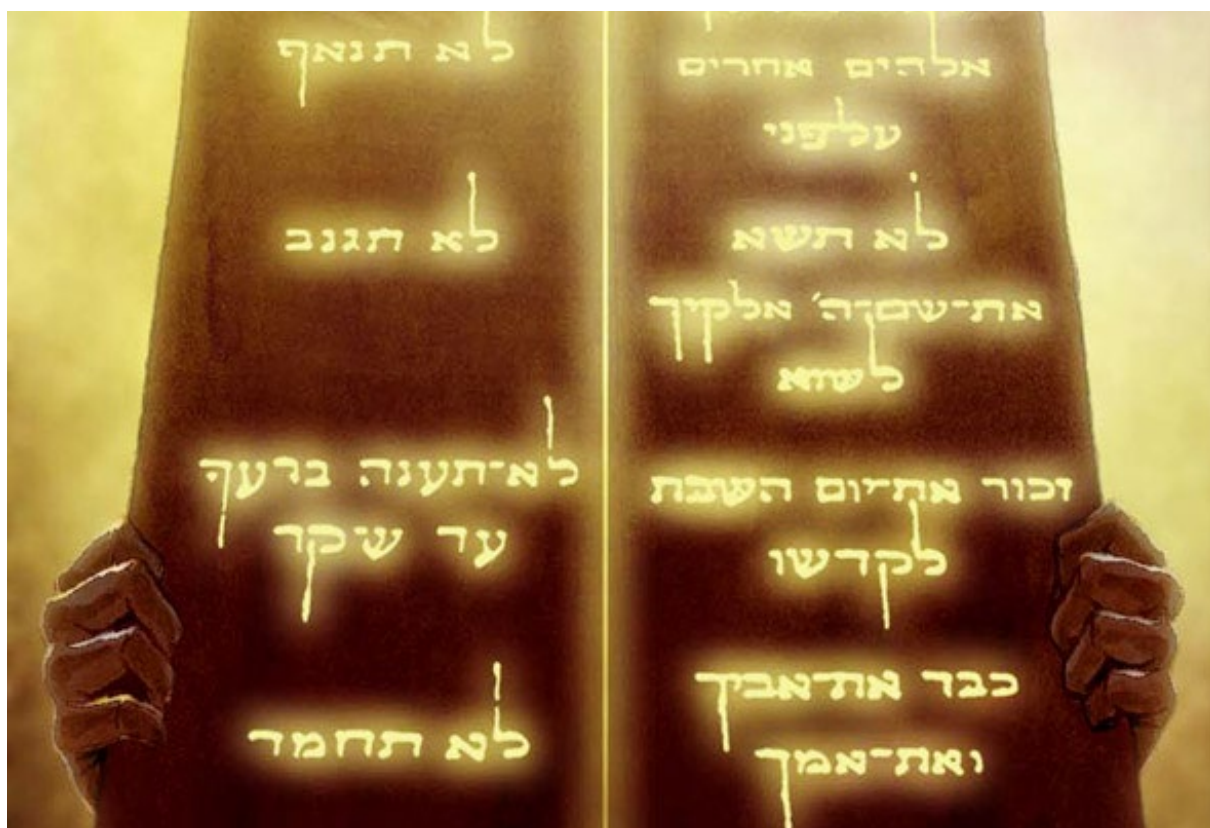
Фрагмент картины «Получение Торы». Рав Гади Поллак