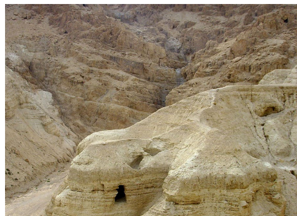
Кумранские пещеры.

Ответы на все эти вопросы мы сможем получить только тогда, когда хотя бы часть зарытых сокровищ будет обнаружена археологами. Или когда придет Машиах, да придет он вскоре, в наши дни! А до тех пор тайна Медного свитка останется тайной, будоража воображение и археологов, и кладоискателей.