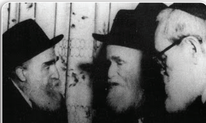
Великие наставники американского еврейства: рав Моше Файнштейн, рав Аарон Котляр и рав Яков Каменецкий.

В одежде крестьянина рав Моше Файнштейн пробрался в Москву, тщательно избегая любых встреч с представителями властей. В Москве его приютила семья стариков. В их доме он спал, а все время, не связанное с хлопотами о визе, он проводил в доме учения.