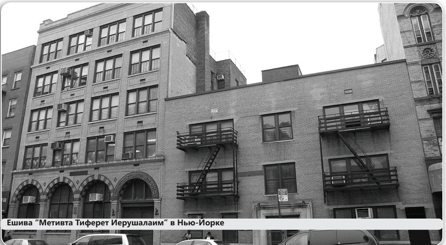
Ешива «Метивта Тиферет Иерушалаим» в Нью-Йорке

Отношение рава Моше к ученикам было подобно отношению отца к собственным детям. Он никогда не повышал голоса, не допускал порицаний. Даже на экзаменах он пользовался формулировками типа «давайте ответим на следующий вопрос», «давайте подумаем». Если ученик явно не выдерживал экзамена, то рав Моше чаще всего говорил: «я не сомневаюсь в ваших знаниях, но хотел бы поговорить с вами еще раз через две недели».