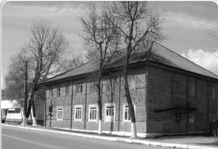
Синагога в Любани. Разрушена уже в наши дни.