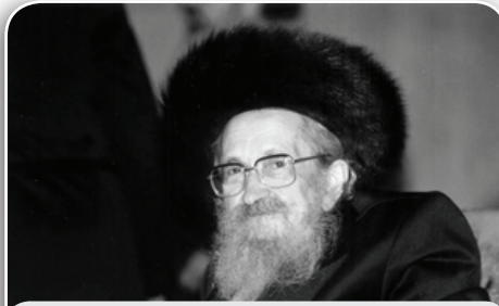
Рав Шалом Ноах Березовский, автор книги «Нетивот Шалом»

Существо человека делится на три обители – нижняя, вторая и третья. Душевные качества разума, сердца и органов тела служат обителью вожделений. В соответствии с тремя этими обителями – три главы. «Когда выйдешь ты на войну на врага твоего и увидишь коней и колесницы...» – глава, говорящая о заповеданной войне, намекающая на войну с тем, что запрещено Торой, войну, относящуюся к органам тела, служащим вместилищем вожделений. Вторая глава, «Когда выйдешь на войну на врага твоего», говорящая о войне разрешенной (но не заповеданной), намекает на войну в том, что дозволено Торой. В отношении этого заповедано еврею «освящать себя в дозволенном», в том, что подчиняется влечению сердца. Эта война – не за то, чтобы не допустить запрещенного, а за то, чтобы посвятить Всевышнему влечения сердца. Третья, «Когда выйдешь лагерем на врага твоего – остерегайся всего дурного», – говорит о том, что отдано разуму. Как сказано об этом мудрецами: «Пусть не помышляет человек днем о таком, что приведет его к скверне ночью». Три эти главы говорят о трех войнах, которые предстоит вести еврею в течение всей его жизни.