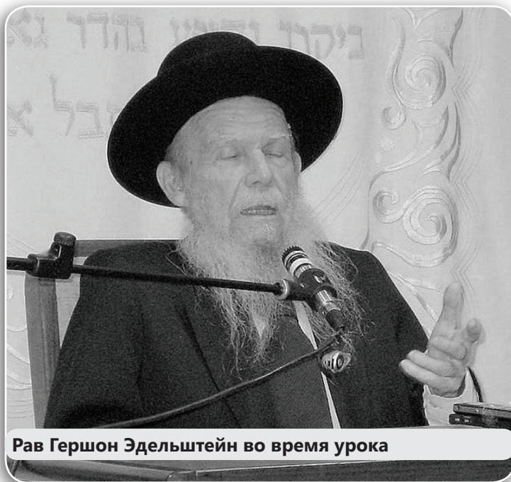
Рав Гершон Эдельштейн во время урока

Отсюда начинается наша просьба: «Он откроет наше сердце Своей Торой» , то есть откроет нам сердце с помощью Торы – чтобы мы обрели все