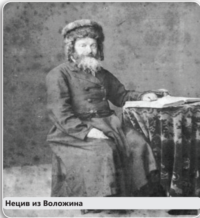
Нецив из Воложина

В этом было великое достоинство праотцов: помимо того, что они были праведными, благочестивыми и любящими Всевышнего, насколько возможно, они были еще и прямыми. Это означает, что они относились с любовью к народам мира, даже к самым закоренелым идолопоклонникам, и старались помочь им, как это ясно видно на примере Авраама, старавшегося молитвой своей спасти жителей Сдома. Хотя он и ненавидел их и их царя великой ненавистью за их злодейство, как это следует из его слов, обращенных к тому царю, он желал их существования. В Мидраш Раба (Ваера, 49) говорится, что Всевышний сказал Аврааму: ты любишь оправдание и ненавидишь зло; любишь оправдывать творения Мои и ненавидишь обвинять их и т. д. И этим Авраам – как