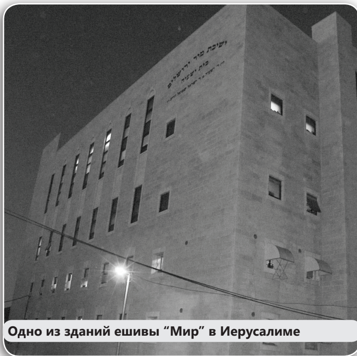
Одно из зданий ешивы «Мир» в Иерусалиме