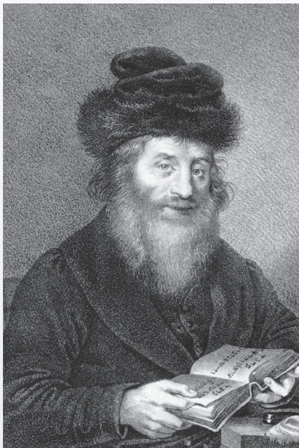
Рав Моше Софер (Хатам Софер)

Основная тяжесть этого испытания заключалась не в самом заклятии Ицхака, и даже