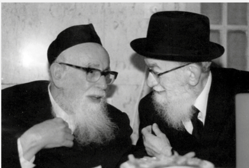
Рав Шломо Залман Ойербах и рав Гедалья Айзман