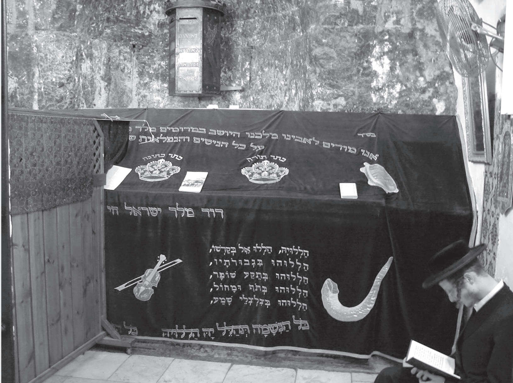
Могила царя Давида

мудрецом, чем царь Шломо, и великим пророком, близким к нашему наставнику Моше. Поэтому он будет обучать весь народ и указывать ему путь Творца».