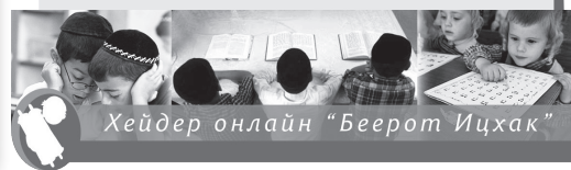
Хейдер онлайн "Беерот Ицхак"

Поддерживая Фонд «Беерот Ицхак», Вы становитесь нашим партнером в деле укрепления изучения и распространения Торы. Этот журнал, который Вы держите в руках, колепи в Иерусалиме, Кирьят Сефере и Брахфельде, программу учебы для женщин, хейдер онлайн для детей, уроки Торы и издание книг, программы по укреплению еврейских семей и ряд других программ – во всех этих проектах у Вас будет своя доля! Любое Ваше участие очень важно для нас!